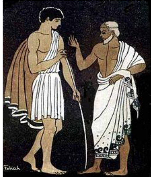
Abbildung 1: Telemachos und Mentor

Heute definiert sich Mentoring als „zwischenmenschliche Beziehung zwischen einer erfahrenen Person, dem Mentor (...), und einer weniger erfahrenen Person, der/dem Mentee“ (Sloane & Fuge, 2012, S. 97); in Ihrem Fall also einem Studierenden höheren Semesters und mehreren Erstsemestern, die persönliche Beratung, Lerntipps und Vernetzung durch Sie und den Austausch mit anderen Mentees erfahren.